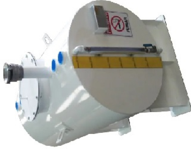
TANQUE DE DIESEL AÇO CARBONO PINTADO