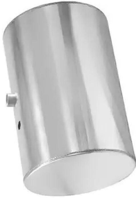
TANQUE DE DIESEL ALUMINIO OU INOX