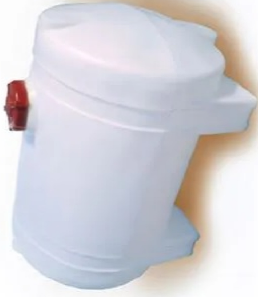
TANQUE DE DIESEL EM PVC