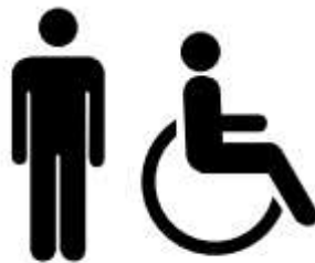
Figura 45 – Sanitário masculino acessível