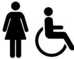
Figura 44 – Sanitário feminino acessível