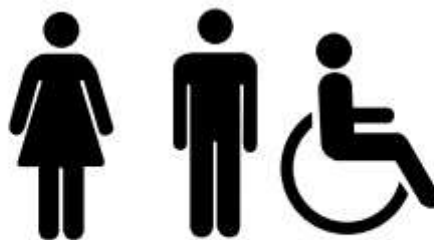
Figura 46 – Sanitário feminino e masculino acessível